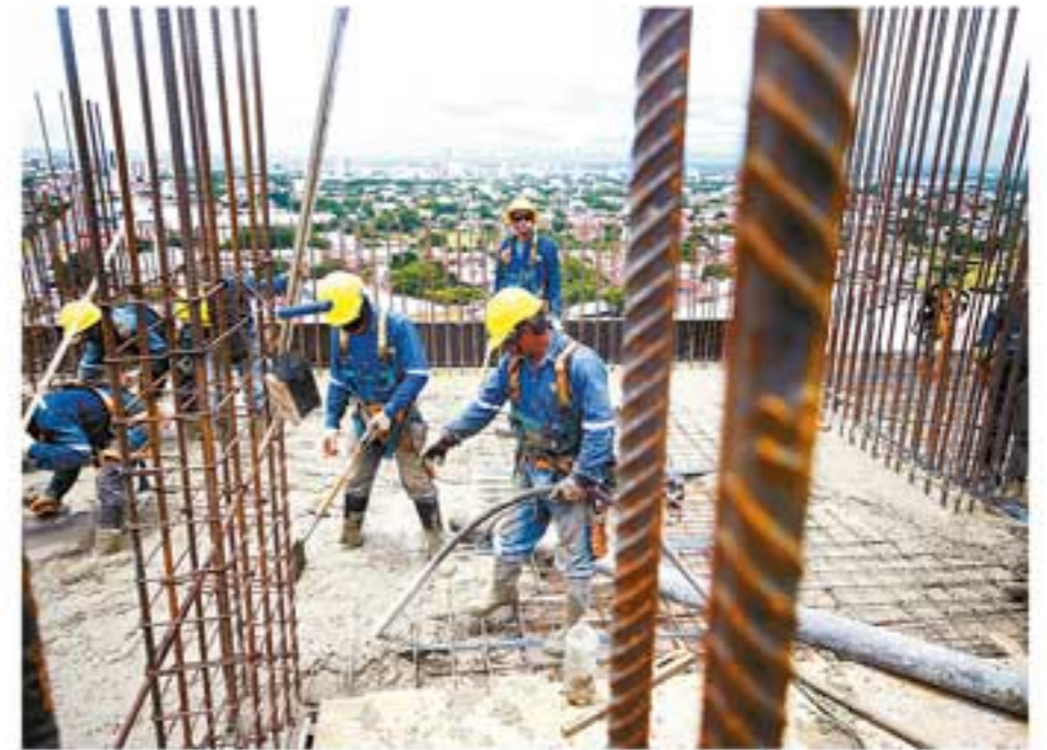
El Observatorio Urbano realiza un censo de obras en construcción

El Centro beneficiará a trabajadores de todo el país con la formación y certificación, herramientas para seguir avanzando en la prevención de riesgos laborales, actualización, tecnificación, calidad. En este proyecto participa la Confederación Sindical de Trabajadores de la Construcción de Bolivia y su organización filial en Santa Cruz.