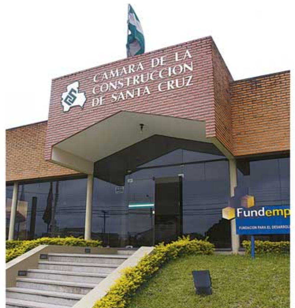
Las instalaciones están ubicadas en la Av. Santos Dumont N° 3223

La información de valor estratégico, asesoramiento, representación ante instancias públicas y privadas con la agenda urgente, la de mediano y largo plazo de los constructores, se suman a las gestiones de la institución con la meta puesta en construir Bolivia con empresas y manos bolivianas.