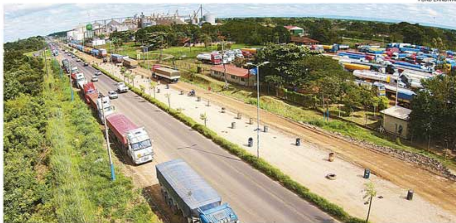
El 69% del transporte de carga se hace en camiones, el 1% en aviones, el 30% en tren y el 9% en barcazas

El proyecto Hub Viru Viru es vital para fortalecer la red de transporte de Bolivia, ya que por su ubicación, el movimiento logístico de Sudamérica se centraría en nuestro país. Para este proyecto se requieren $us 300 millones y otros $us 700 millones para obras en ciudades intermedias a fin de tener un sistema aeroportuario internacional.