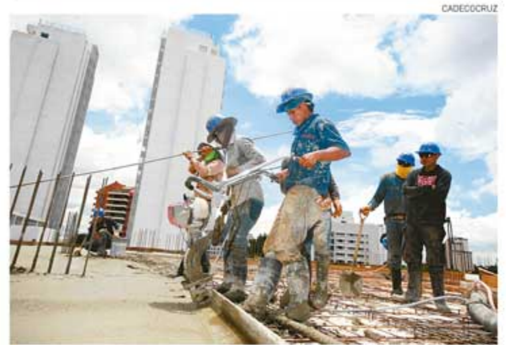
El país debe hablar el mismo idioma técnico que el resto del mundo