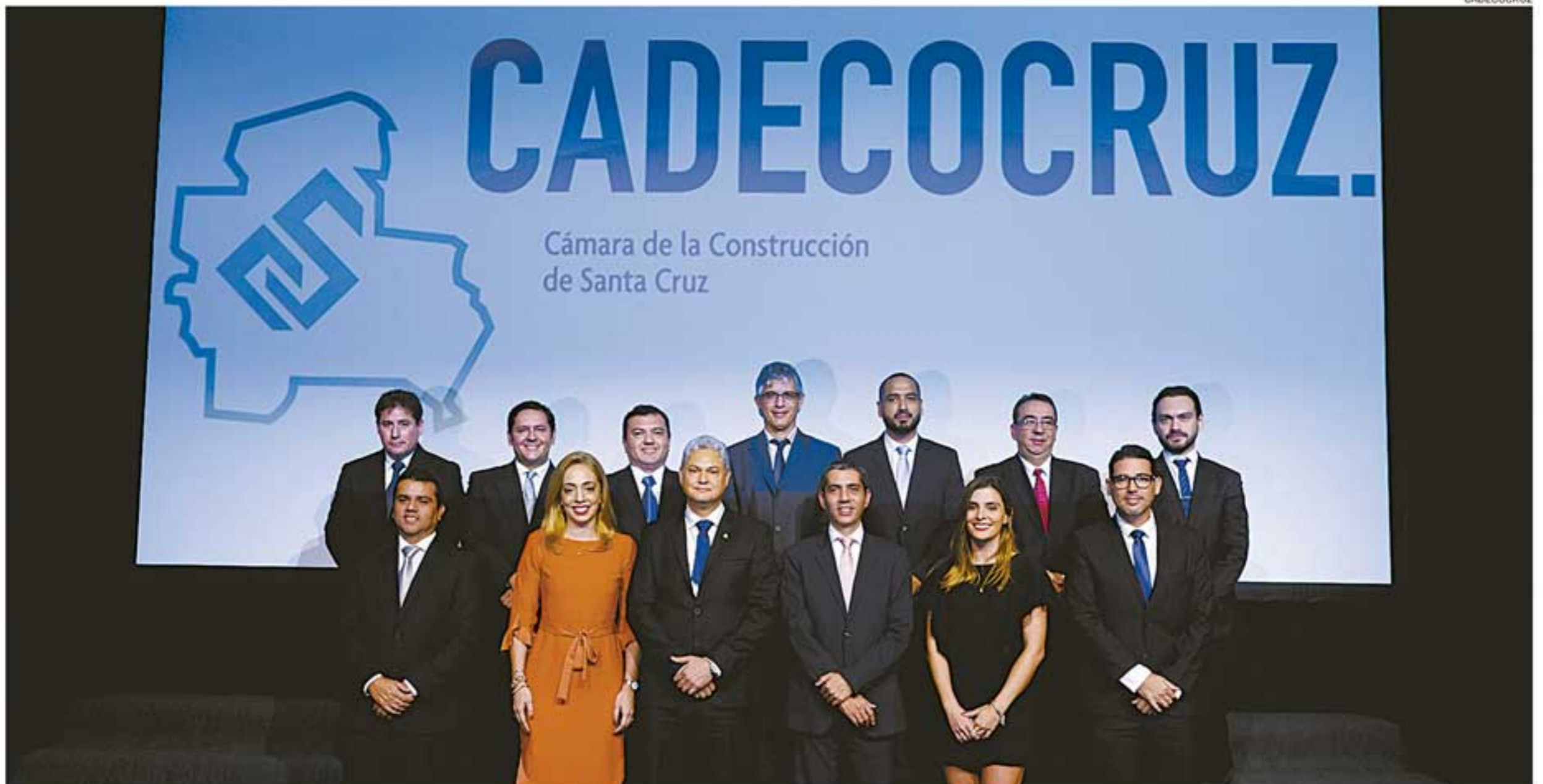
El Directorio está conformado por destacados profesionales, que tienen la misión de velar por los derechos de las empresas asociadas